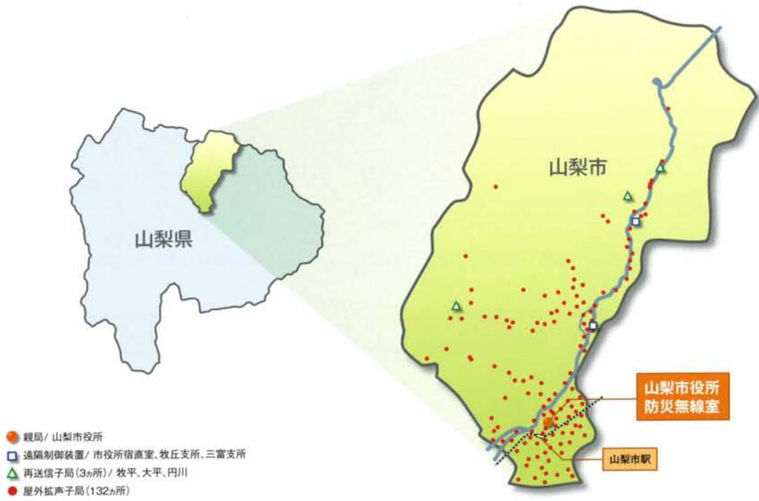
ネットワーク構成図